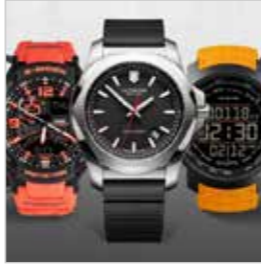
Sport & Leisure