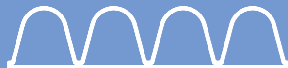
tissuePack con onde da 20 mm